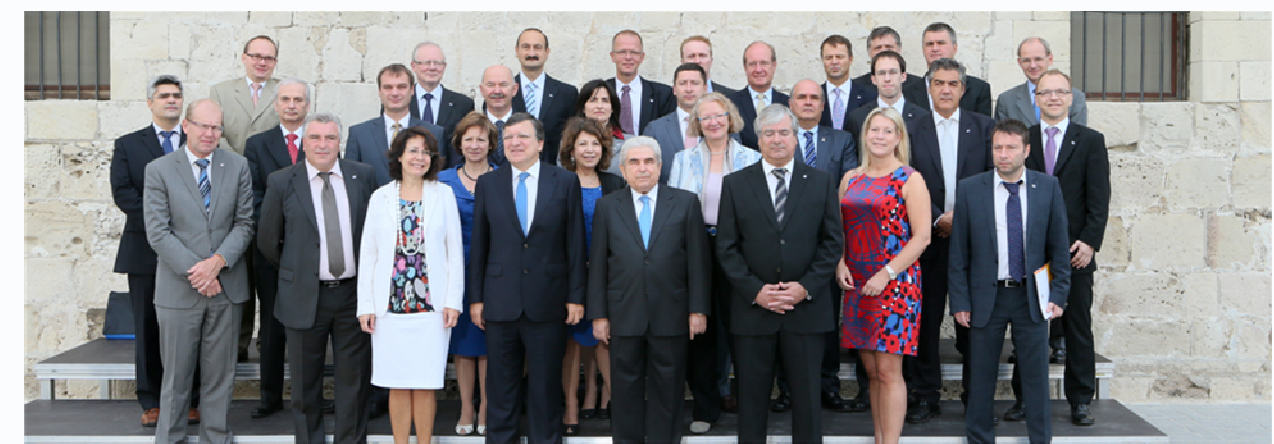
Informal Ministerial Meeting on EU Integrated Maritime Policy 7-8 October 2012 The Limassol Declaration

Υπογραμμίζεται ότι το Συμβούλιο Γενικών Υποθέσεων τον Δεκέμβριο του 2012 ενέκρινε σχετικά Συμπεράσματα μέσα από τα οποία υιοθετεί το περιεχόμενο της Διακήρυξης. Τα εν λόγω Συμπεράσματα αναγνωρίζουν ότι η Διακήρυξη της Λεμεσού αποτελεί βασική συνιστώσα της Στρατηγικής Ευρώπη 2020 που υποστηρίζει την ανάπτυξη, την ανταγωνιστικότητα και την δυνατότητα δημιουργίας νέων θέσεων εργασίας μέσα από την Γαλάζια Οικονομία.